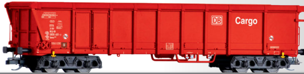
Rolldachwagen Tamns 893 der DB Cargo Sliding roof car Tamns 893 of the DB Cargo