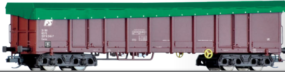
Offener Güterwagen Eanos der FS mit Plane Open car Eanos of the FS with tarpaulin