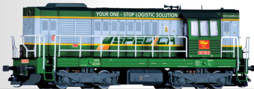
Diesellokomotive Reihe 742 der RM Lines a.s. (CZ) / SPEDICA Diesel locomotive class 742 of the RM Lines a.s. (CZ) / SPEDICA • Mit freundlicher Unterstützung von SPEDICA / Licensed by SPEDICA