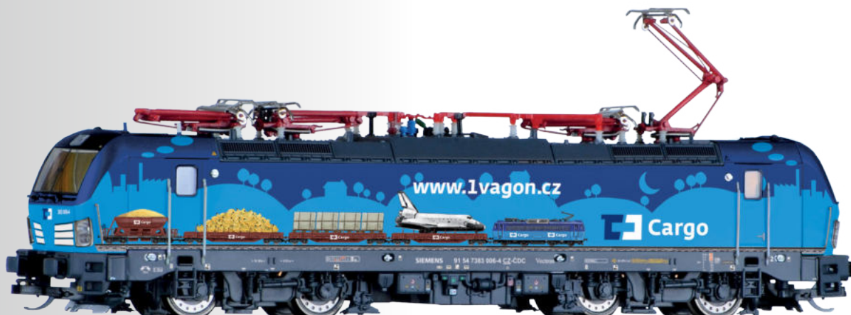
Elektrolokomotive Reihe 383 der ČD Cargo Electric locomotive class 383 of the ČD Cargo • Mit freundlicher Unterstützung von ČD Cargo / Licensed by ČD Cargo