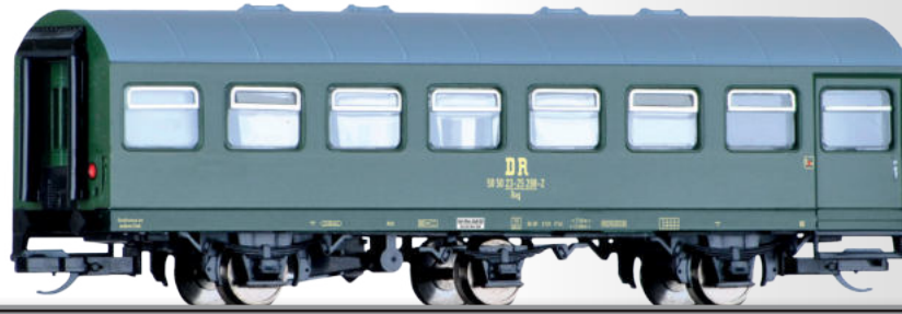
Reisezugwagen 2. Klasse Bag der DR 2nd class passenger coach Bag of the DR