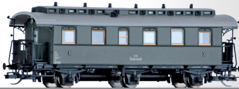
Reisezugwagen 3. Klasse C3i der BBÖ 3rd class passenger coach C3i of the BBÖ