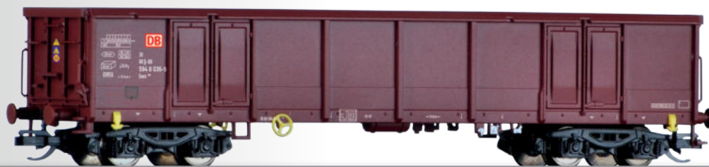
Offener Güterwagen Eans 069 der DB AG Open car Eans 069 of the DB AG