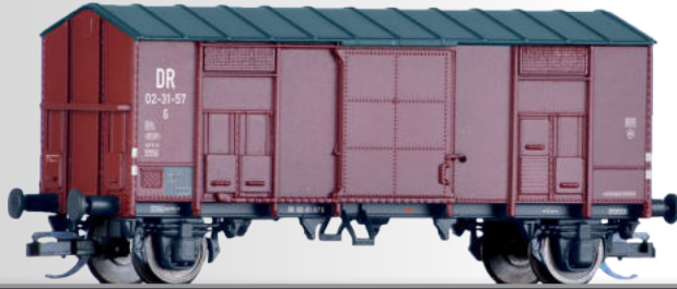
• Güterwagen italienischer Bauart / Freight car italian type