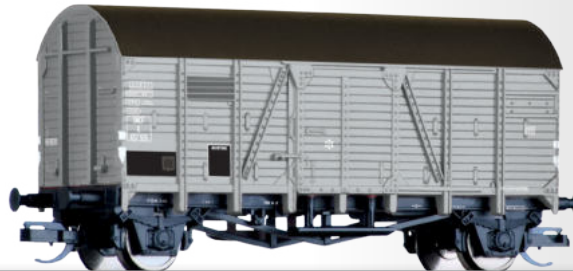
Gedeckter Güterwagen K der SNCF Box car K of the SNCF