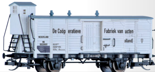
Wärmeschutzwagen „Cooperatieve Fabriek van Melkproducten“, eingestellt bei der NS Box car “Cooperatieve Farbriek van Melkroducten” of the NS