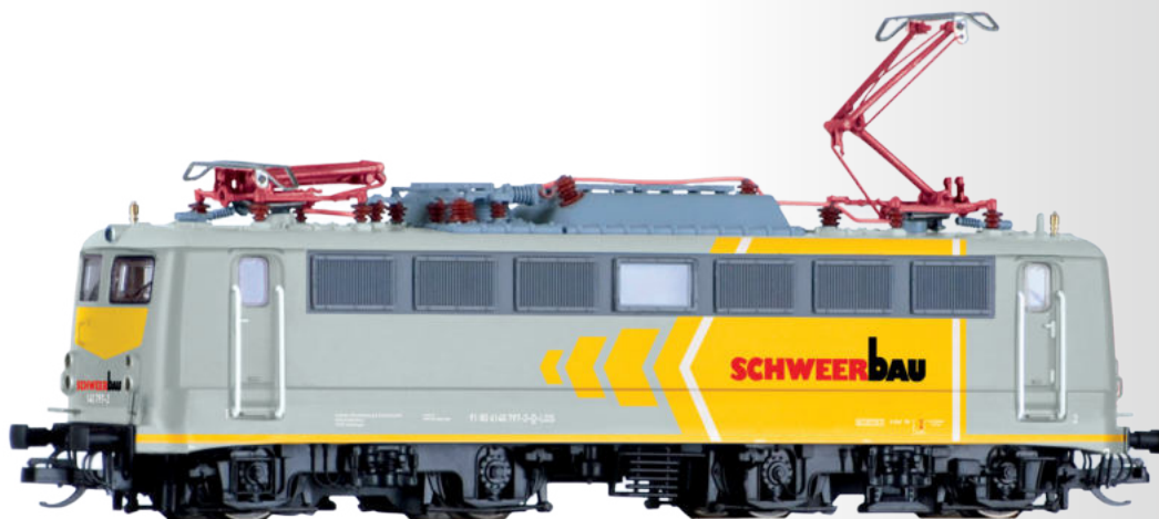
Elektr locomotive 140 797-2 der LDS GmbH, vermietet an die Schweerbau GmbH & Co. KG Electric locomotive 140 797-2 of the LDS GmbH