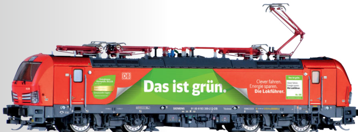
Elektrolokomotive 193 309-2 „Das ist grün“ der DB AG Electric locomotive 193 309-2 „Das ist grün“ of the DB AG