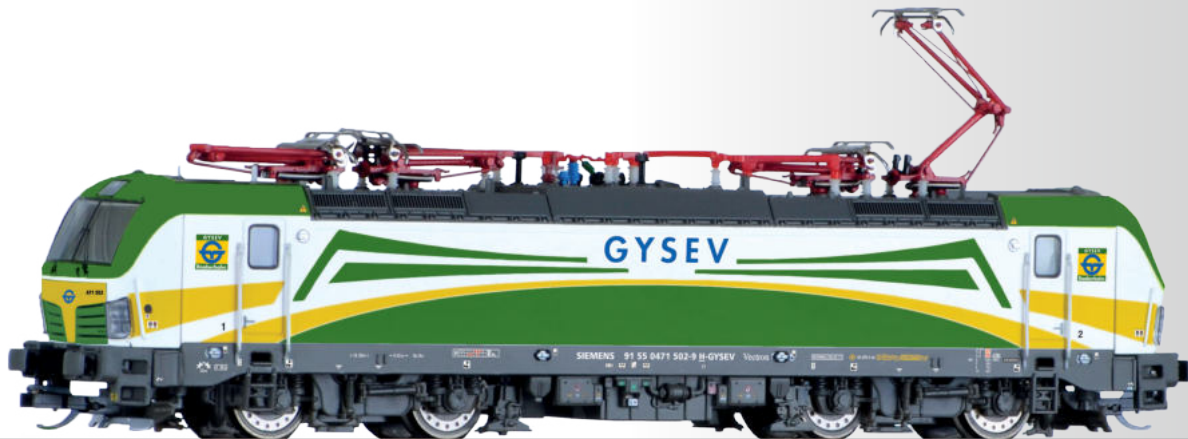
Elektrolokomotive Reihe 471 der GYSEV Electric locomotive class 471 of the GYSEV