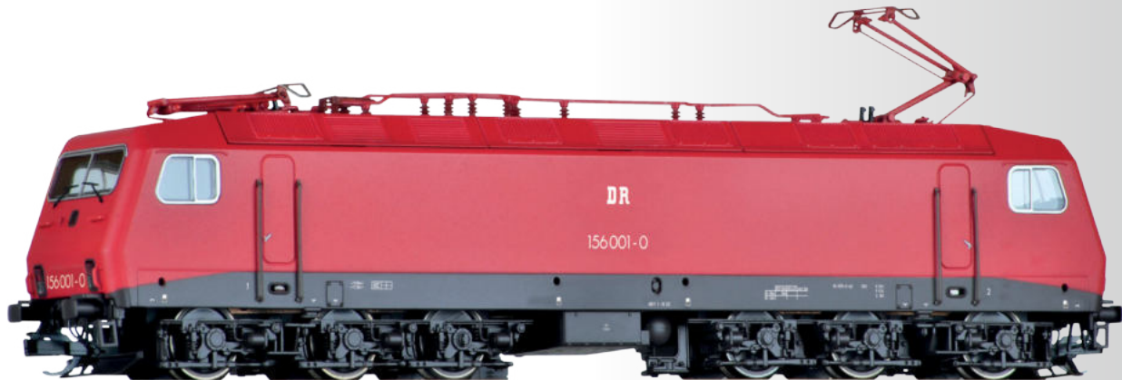
Elektrolokomotive 156 001-0 der DR Electric locomotive 156 001-0 of the DR