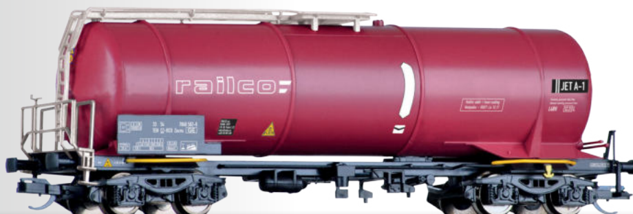
Kesselwagen Zacns der RAILCO (CZ) Tank car Zacns of the RAILCO (CZ)