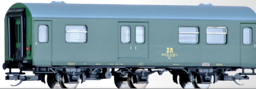
Gepäckwagen Dag der DR Baggage car Dag of the DR