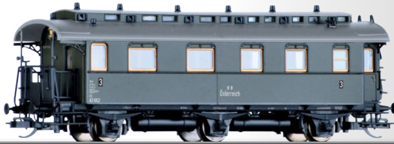
Reisezugwagen 3. Klasse C3i der BBÖ 3rd class passenger coach C3i of the BBÖ