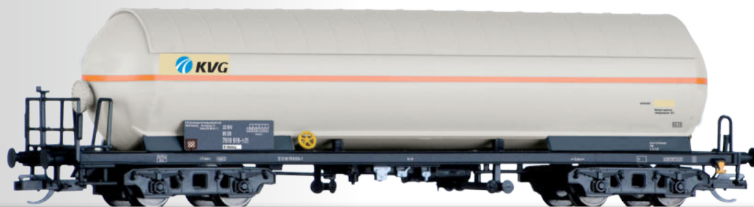
Gaskesselwagen „KVG GmbH“, eingestellt bei der DB AG Gas tank car “KVG GmbH” of the DB AG