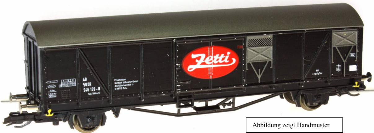
Abbildung zeigt Handmuster