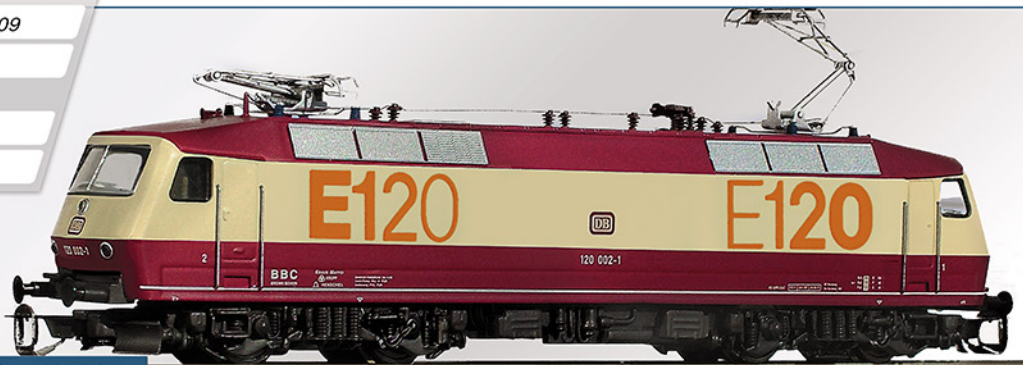
BR 120 DB, Vorserie „E120“

Unser Modell zeigt die besondere Präsentationsausführung „E120“ zur Verkehrsausstellung 1979 in München. Nur noch wenige lieferbar/ Wir produzieren letztmalig ein Produktionslos von 50 Stück.