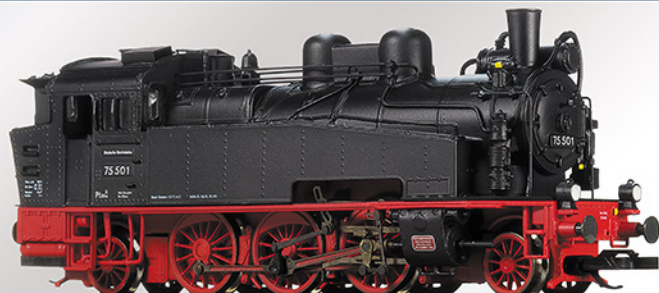
BR 75.5 DR, 75 501, Epoche III

Ursprünglich als Museumslok der DR vorgesehen, wurde die 75 501 1977 an das Deutsche Museum in Neuenmarkt-Wirsberg verkauft. Ab 1960 gehörte sie zum Bw Zittau, wo sie 1967 ausgemustert wurde. Unser Ep.-III-Modell zeigt die 75 501 im Betriebszustand dieses Zeitraums mit Griffstangen an der Rauchkammertür, glattem Schornstein, neuer Bekohlung.