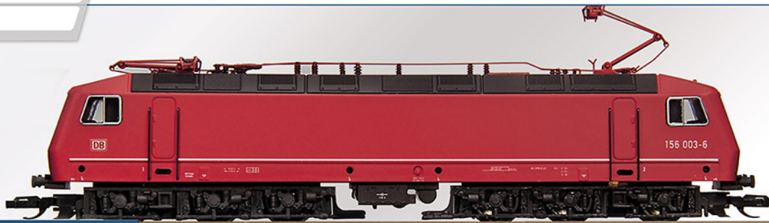
BR 156 DBAG, Epoche V