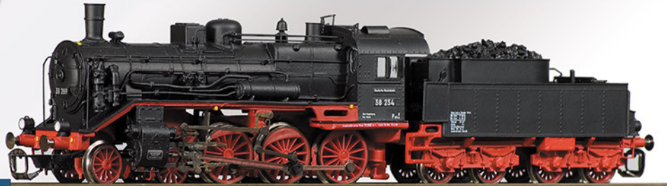
BR 38.2-3 DR, 38 234 Ep. III

Das Modell entspricht der Standardversion der BR 38 mit 4 Stellstangen zum Dampfdom, besitzt einen 5-poligen Motor mit Schwungmasse, wechselnde Spitzenbeleuchtung, digitale Schnittstelle nach NEM651 und Kupplungsaufnahmen nach NEM358.