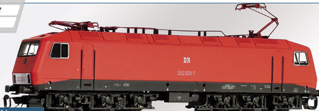
BR 252 DR, Epoche IV

Angetrieben wird die Lok über Kardantrieb von einem 5-poligen Motor.