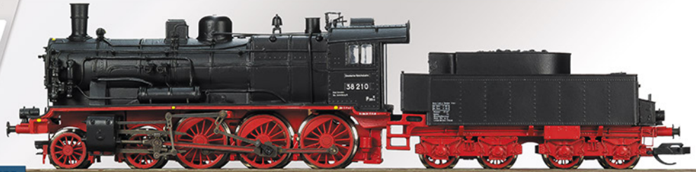
BR 38, 38 210, Epoche III

Unser Modell zeigt den Betriebszustand der 50 bis 60er Jahre, jedoch mit ursprünglicher Steuerungsausführung und tiefliegendem Umlauf. Die Digital- und die Soundversion verfügen außerdem zur weiteren Verbesserung des Fahrverhaltens über einen Stromspeicher.