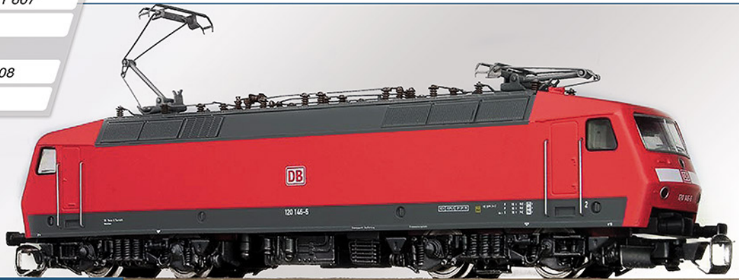
BR 120.1 DB AG Epoche Vb

Dieses Modell entspricht der Serienausführung der BR 120 im verkehrsroten Anstrich der DB AG. Der Antrieb erfolgt von einem 5-poligen Mashima-Motor über Kardanwellen auf alle 4 Achsen. Das Modell besitzt wechselnde Spitzenbeleuchtung.