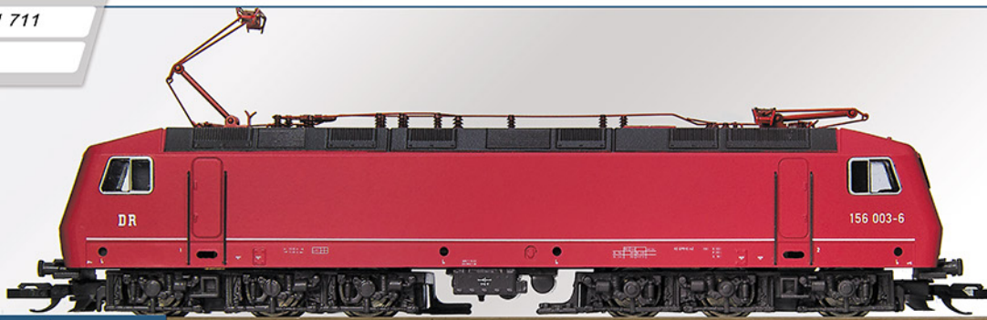
BR 156 DR, Epoche Va

Angetrieben wird die Lok über Kardantrieb von einem 5-poligen Motor.