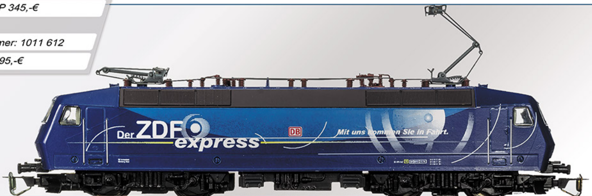
BR 120.1 DB „ZDF“, Ep. V/VI

Dieses Modell wird nur nach Kundenbestellung in Kleinstserie gefertigt. Die Bedruckung ist mit aufwendigen Decals erstellt und mit einem Schutzlack versehen. Der Antrieb erfolgt von einem 5-poligen Mashima-Motor über Kardanwellen auf alle 4 Achsen. Das Modell besitzt wechselnde Spitzenbeleuchtung.