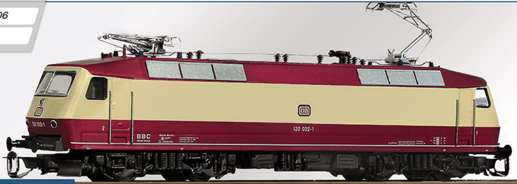
BR 120 DB, Epoche IV

Nach umfangreichen Versuchen einer neuartigen Antriebstechnik mit Drehstrom-Asynchronmotoren wurde der Nachweis erbracht, dass die Möglichkeit besteht, eine Lokomotive für alle Zuggattungen zu bauen. Daraufhin wurden fünf Vorserienlokomotiven der BR 120 bestellt.