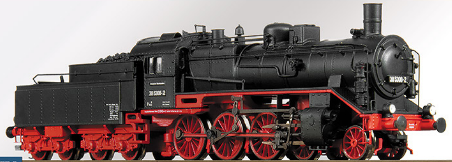
BR 38.2-3 DR, 38 5308-2, Ep. IV

Zwei Fahrzeuge der BR 38 wurden im Original für die Ep. IV mit neuen Nummerschildern versehen. Unser Modell hat diverse, dem Vorbild entsprechende Detailänderungen.