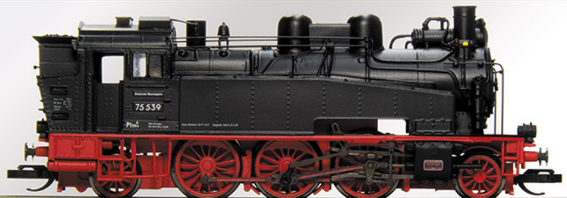
BR 75.5 DR, 75 539, Epoche III

Unser Modell zeigt den Betriebszustand dieser Lok. Der linke Wasserkasten ist mit einem aufgeschweißten Reparaturblech versehen.