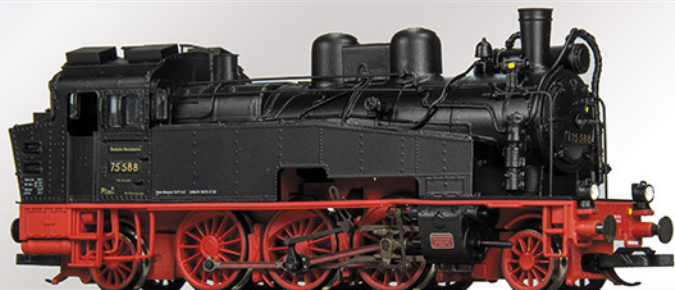
BR 75.5 DRG, 75 588, Ep. II

Änderungen gegenüber bisherigen Varianten: niedriger Kohlenkasten, 3.Fenster in der Führerhausrückwand, 4 Dachhauben, geänderte Leitungsverläufe, Glocke vorne und eine neue Speisepumpe.