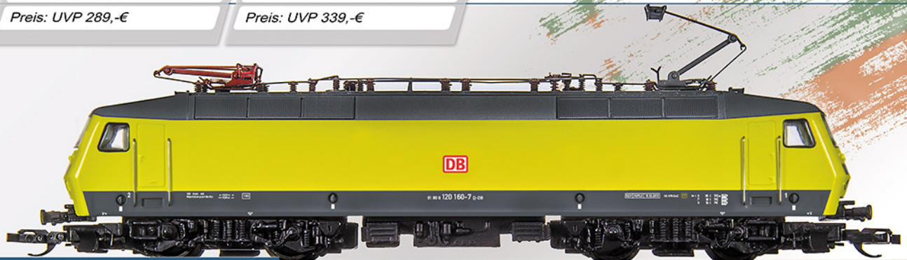
BR120.1, 120502 DB Netz AG

Die ehemalige 120 160-7 zeigt sich seit März 2013 in der gelben Lackierung der Dienstfahrzeuge. Sie wird wie ihre Schwesterlok 120 501 (DB Systemtechnik) vor Messzügen eingesetzt. Unser Modell ist vorbildgerecht geändert und lackiert. Digitalschnittstelle Next18 (NEM662)