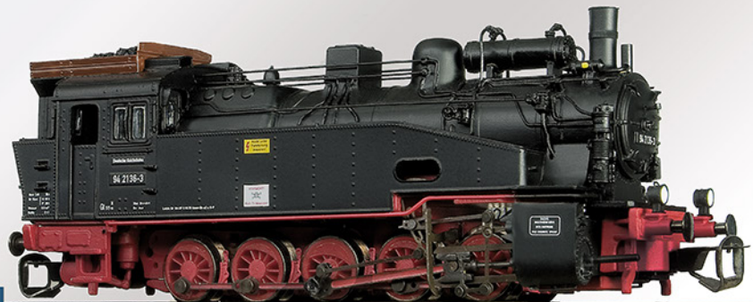
BR 94.20-21 DR, Epoche III

BR 95.66 DR, 95 6676 Epoche III "Mammut" Rbd Magdeburg Bw Blankenburg