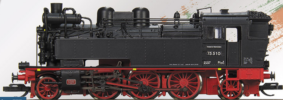
BR 75.5 DR, 75 510, Epoche III

Die Sächsische Maschinenfabrik, vorm. Richard Hartmann, in Chemnitz lieferte 1911/12 die erste Serie der Baureihe 75. Diese hatte, im Gegensatz zu den folgenden Lieferserien, gerade durchlaufende Wasserkästen. Unser Modell zeigt die typischen Änderungen, u.a drittes Spitzenlicht und eine vorbildgerechte Bedruckung. Digitalschnittstelle NEM651 und Kupplungsaufnahme nach NEM358.