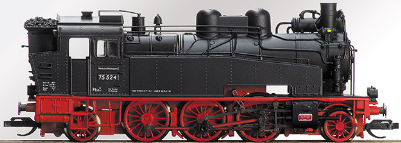
BR 75.5 DR, 75 524, Epoche III

An unserem Modell wurden gegenüber den übrigen Varianten der BR 75.5 vorbildgerecht diverse Anbauteile und Leitungen verändert.