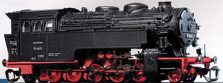
BR 95.66 DR, Epoche III