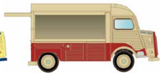
LC4152 Citroën Typ HY, mit offener Verkaufstheke UVP 13,95