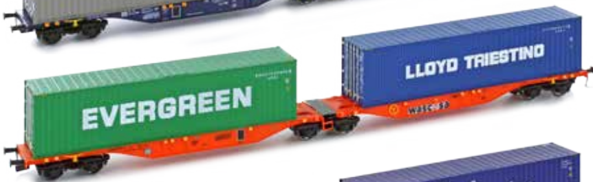
H70502 Sggmrs 90 Wascosa 2x 40' container UVP 59,90