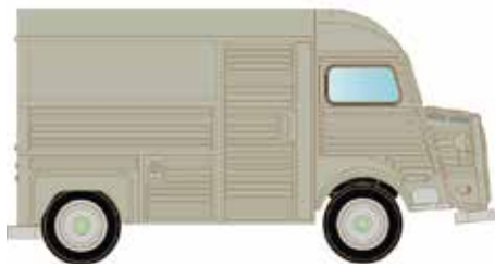
LC4150 Citroën Typ HY, Kasten silber UVP 12,95