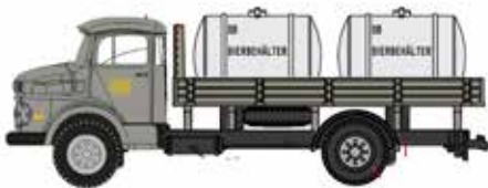
LC3460 MB L 322 „von Haus zu Haus“ mit DB Bier tanks UVP 14,95