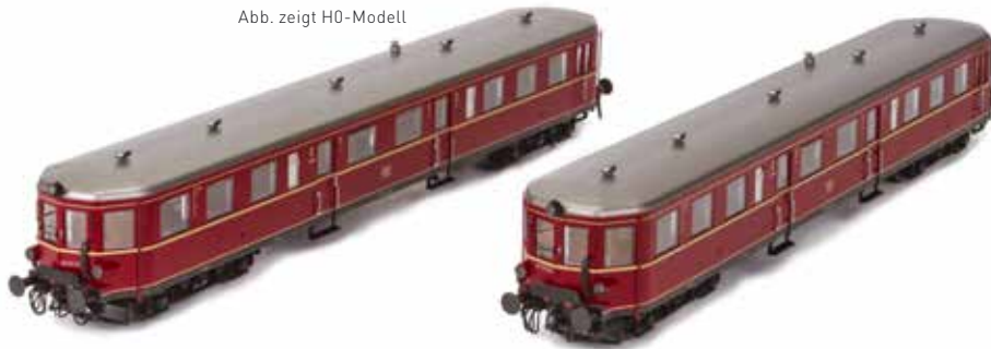
Abb. zeigt H0-Modell

Die beiden Triebwagen VT 36.509 und 519 wurden an die Georgs-Marienhütte Eisenbahn verkauft und dort als VT 1 und VT 2 nach dem Ausscheiden aus dem Bundesbahndienst Ende 1966 eingereiht.