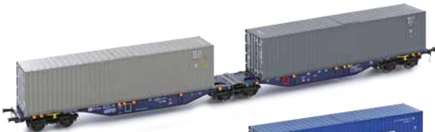
H70501 Sggmrs 90 ITL 2x 40' container UVP 59,90