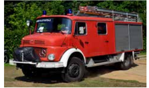
LC4202 LF 16 Ts Düsseldorf UVP n.F.