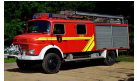
LC4204 LF 16 Ts Freiwillige Feuerwehr Lotte/Os. UVP n.F.