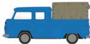
LC3875 VW Bus T2 Doppelkabine, Pritsche/Plane UVP 9,95