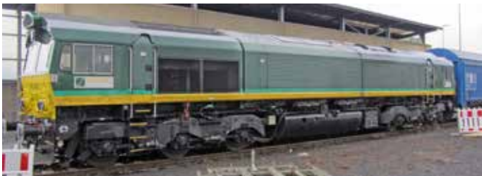
H70003 Class 66 Ascendos / ITL Ep. VI UVP 189,90