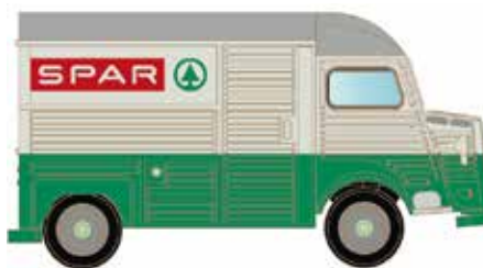
LC4154 Citroën Typ HY, Spar UVP 13,95