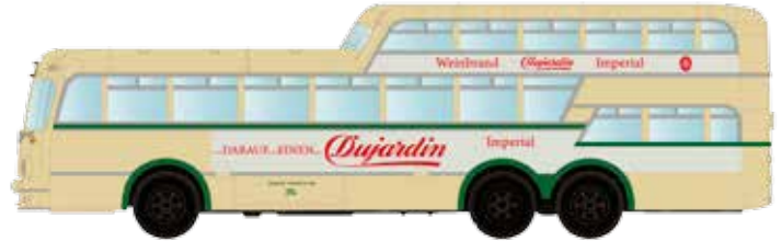
LC3912 Büssing Aero 1 1/2 Deck Omnibus Essen „Dujardin“ UVP 24,95