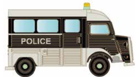
* LC4159 Citroën Typ HY, Police UVP 13,95