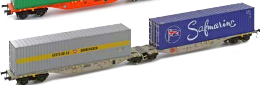
H70503 Sggmrs 90 AAE 2x 40' container UVP 59,90