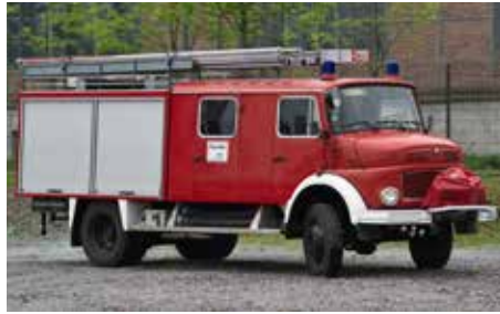
LC4201 LF 16 Ts neutral rot UVP n.F.