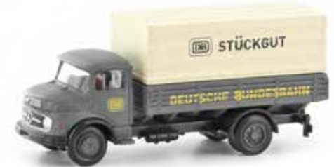
LC3438 MB L 322 DB Stückgut UVP 13,95