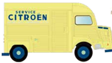
LC4151 Citroën Typ HY, Citroen Service Kasten UVP 13,95