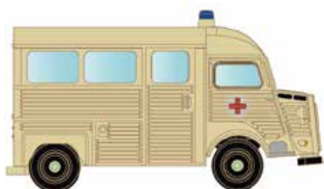
* LC4160 Citroën Typ HY, Krankenwagen UVP 13,95