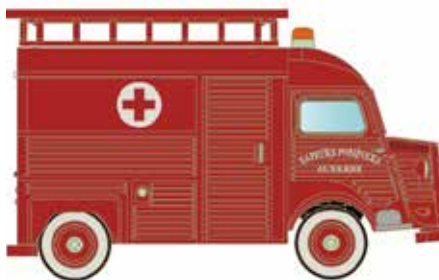
* LC4157 Citroën Typ HY, Feuerwehr Sapeurs Pompiers UVP 13,95