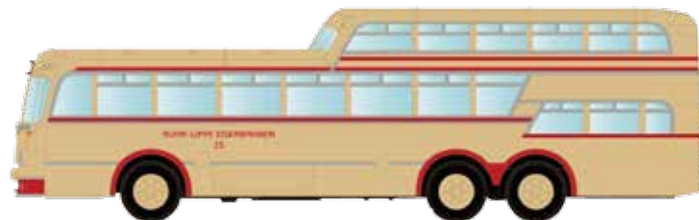
LC3911 Büssing Aero 1 1/2 Deck Omnibus „Ruhr-Lippe-Eisenbahn“ UVP 24,95