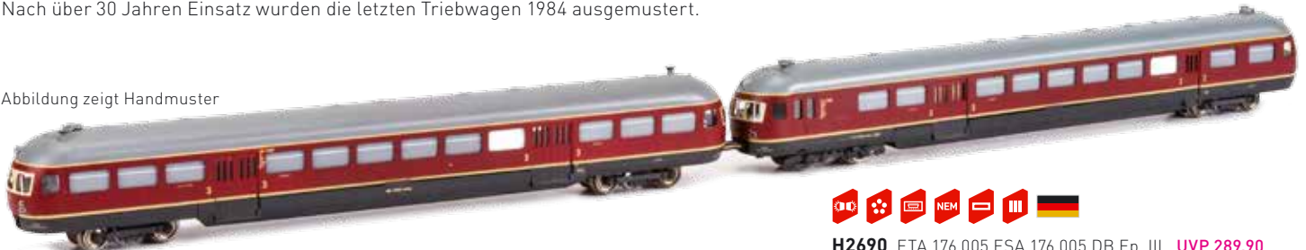
Abbildung zeigt Handmuster

1952 stellte die Deutsche Bahn die ersten Akkutriebwagen der Nachkriegsbauart vor. Diese sollten als ETA 176 bezeichnet sowohl im Nahverkehr, als auch als komplette Eilzüge einsetzbar sein. Nach über 30 Jahren Einsatz wurden die letzten Triebwagen 1984 ausgemustert.