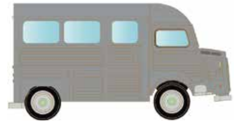
LC4155 Citroën Typ HY, Bus silber UVP 12,95