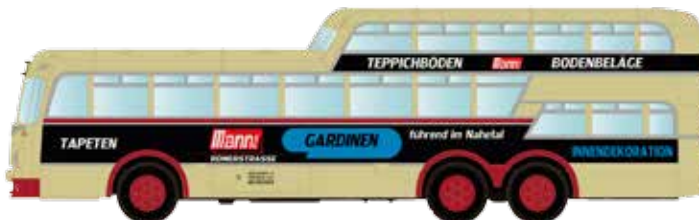
LC3913 Büssing Aero 1 1/2 Deck Omnibus Bad Kreuznach „Mann KG“ UVP 24,95