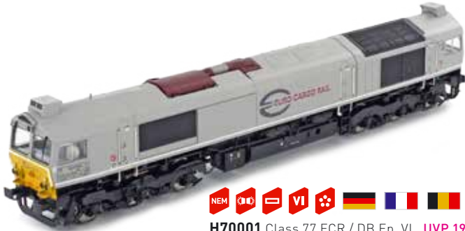
H70001 Class 77 ECR / DB Ep. VI UVP 199,90