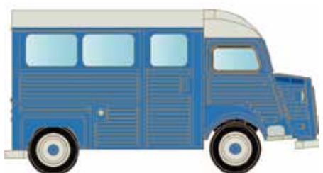
LC4156 Citroën Typ HY, Bus blau UVP 12,95