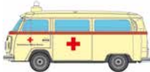
LC3872 VW Bus T2 Kastenwagen „DRK“ UVP 10,95