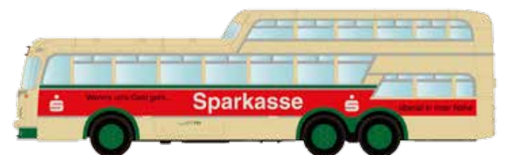
LC3914 Büssing Aero 1 1/2 Deck Omnibus Hagen „Sparkasse“ UVP 24,95