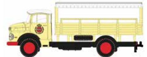
LC3462 MB L 322 Getränkepritsche „Warsteiner“ UVP 13,95