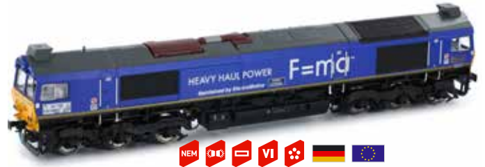
H70002 Class 77 HHPI Ep. VI UVP 199,90