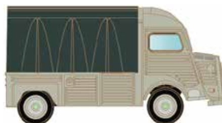
LC4161 Citroën Typ HY, Pritsche Plane UVP 12,95