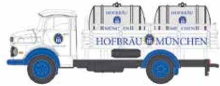
LC3461 MB L 322 DB Hofbräu mit Bier tanks UVP 14,95