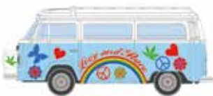
LC3870 VW Bus T2 Westfalia Camper „Hippie Bus“ UVP 10,95