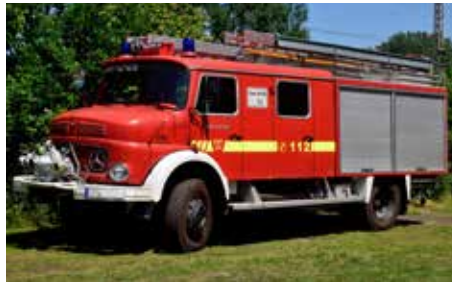
LC4203 LF 16 Ts 112 Freiwillige Feuerwehr UVP n.F.