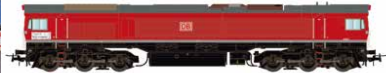
H70004 Class 66 DB Schenker Ep. VI UVP 189,90