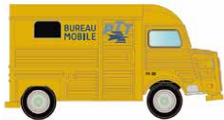
* LC4153 Citroën Typ HY, PTT Fr. UVP 13,95