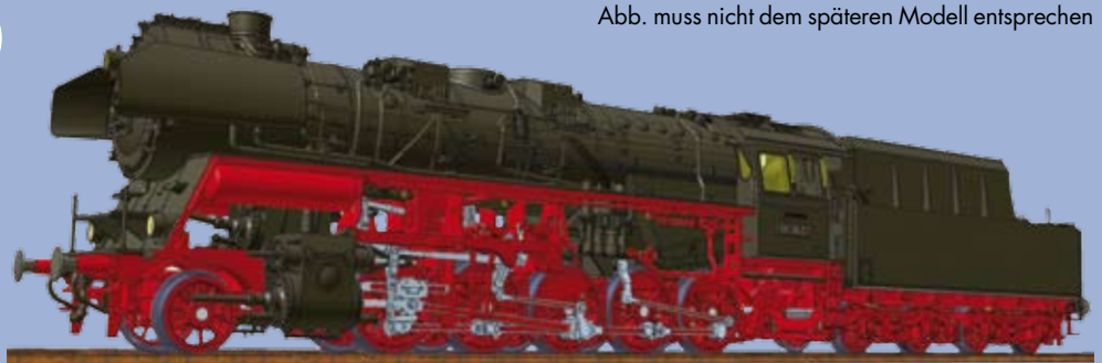
Abb. muss nicht dem späteren Modell entsprechen

76 100 Dampflokomotive BR 58.30 Reko der DR mit Neubautender 2'2'T 28